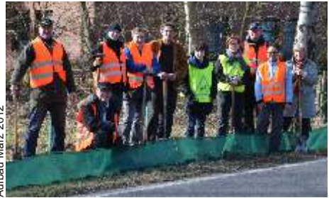
Aufbau März 2012