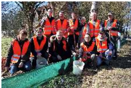
Aufbau März 2011